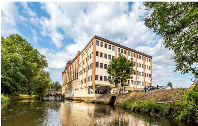
Kuvateksti: Neudorff-keskus Emmerthalissa, Saksassa, tuottaa omaa virtaa Emmer-joen vesivoimaloissa.

Neudorff-tuotteita on saatavilla kautta maailman. Lisätietoja Neudorffista ja sen luonnonmukaisille puutarhureille tarkoitetuista tuotteista on osoitteessa www.neudorff.fi